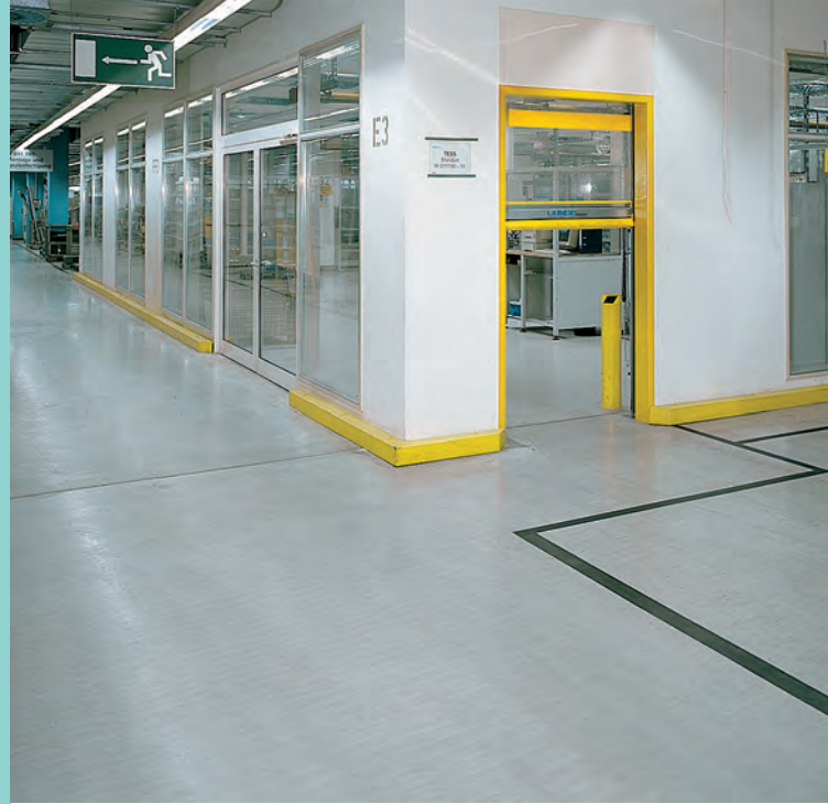
Abb. oben Fertigung, Bosch, Titelseite Verschieberegal, AMG