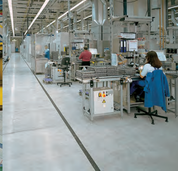
Abb. links Stanzerei, Bosch, -oben Endmontage